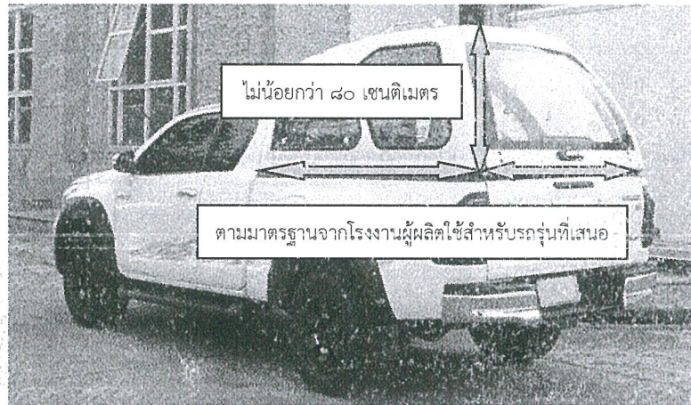
รูปภาพประกอบตัวอย่างหลังคาไฟเบอร์กลาส