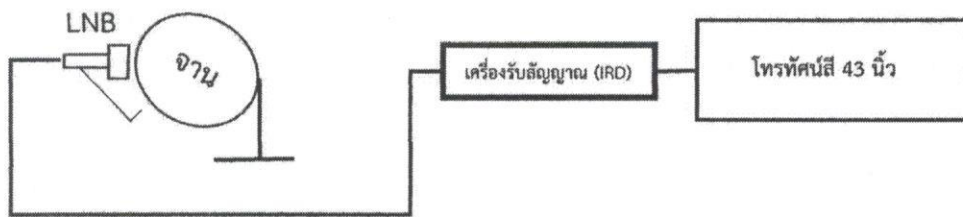
ภาพประกอบการติดตั้งจานดาวเทียม กลุ่มที่ 1

5.1.7 ต้องเดินสายไฟฟ้าชนิด VAF 1.5 SQ.mm. ตามมาตรฐานที่การไฟฟ้ากำหนด ที่มีเต้ารับไม่น้อยกว่า 2 ช่อง สำหรับ Smart TV และเครื่องรับสัญญาณภาพดาวเทียม (IRD)