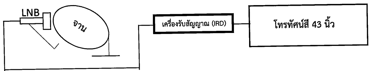
ภาพประกอบการติดตั้งจานดาวเทียม กลุ่มที่ 1

5.1.7 ต้องเดินสายไฟฟ้าผ่านอุปกรณ์ควบคุม เช่น คัทเอาต์ หรือ เบรกเกอร์ หรือ ตู้ load center หรือดีกว่า โดยใช้สายไฟฟ้าชนิด VAF 1.5 SQ.mm. ตามมาตรฐานที่การไฟฟ้ากำหนดที่มีได้รับไม่น้อยกว่า 2 ช่อง สำหรับ Smart TV และเครื่องรับสัญญาณภาพดาวเทียม (IRD)