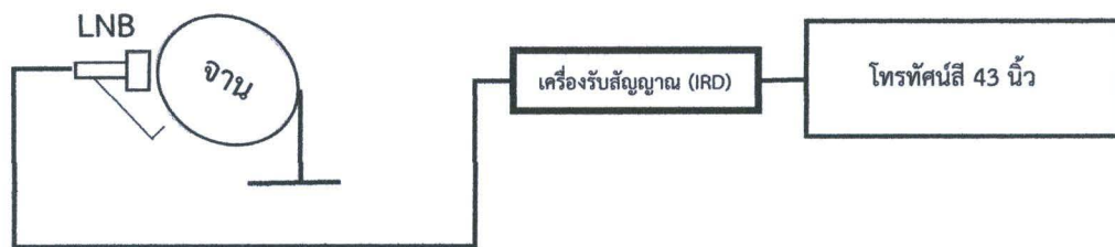
ภาพประกอบการติดตั้งจานดาวเทียม กลุ่มที่ 1

5.1.7 ต้องเดินสายไฟฟ้าชนิด VAF 1.5 SQ.mm. ตามมาตรฐานที่การไฟฟ้ากำหนด ที่มีเต้ารับไม่น้อยกว่า 2 ช่อง สำหรับ Smart TV และเครื่องรับสัญญาณภาพดาวเทียม (IRD)