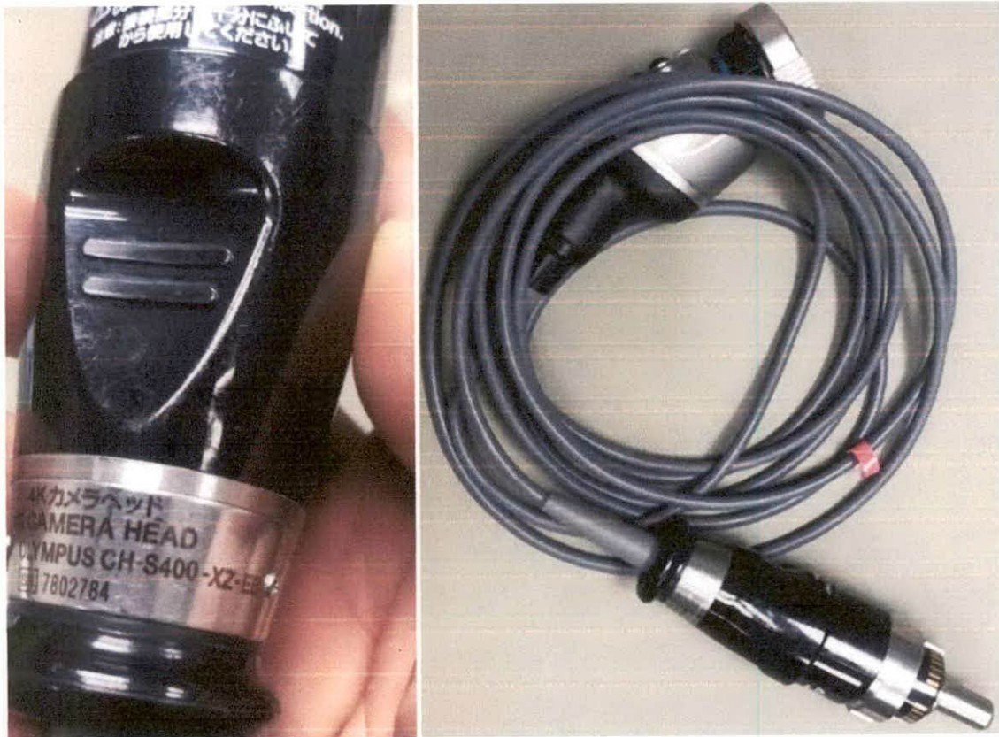
(รูปภาพ ชุดผ้าตัดสองกล่องความคมชัดสูง)

ความต้องการซ่อมสายนำสัญญาณภาพผลิตภัณฑ์โอลิมปัส ด้วยการเปลี่ยนอุปกรณ์เพื่อให้สายนำสัญญาณภาพสามารถใช้งานได้ตามปกติ คุณสมบัติด้านเทคนิคอุปกรณ์สำหรับสายนำสัญญาณภาพ ผลิตภัณฑ์โอลิมปัส รุ่น CH-S400-XZ-EB หมายเลขเครื่อง 7802784 โดยการเปลี่ยนอุปกรณ์ดังนี้