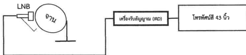
ภาพประกอบการติดตั้งจานดาวเทียม กลุ่มที่ 1

5.1.7 ต้องเดินสายไฟฟ้าชนิด VAF 1.5 SQ.mm. ตามมาตรฐานที่การไฟฟ้ากำหนด ที่มีเต้ารับไม่น้อยกว่า 2 ช่อง สำหรับ Smart TV และเครื่องรับสัญญาณภาพดาวเทียม (IRD)