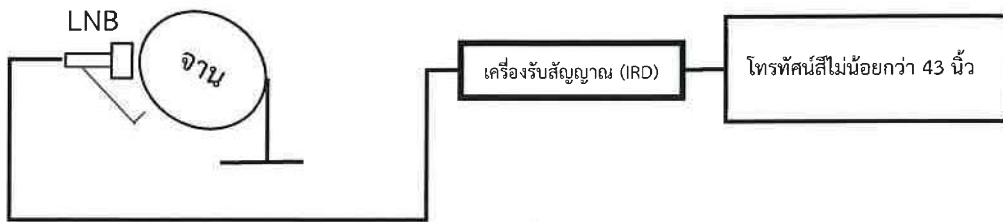
ภาพประกอบการติดตั้งจานดาวเทียม กลุ่มที่ 1

5.2 กลุ่มที่ 2 คือโรงเรียนที่ได้รับจัดสรรอุปกรณ์ ประกอบด้วย