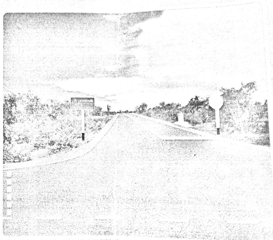
กระทรวงคมนาคม