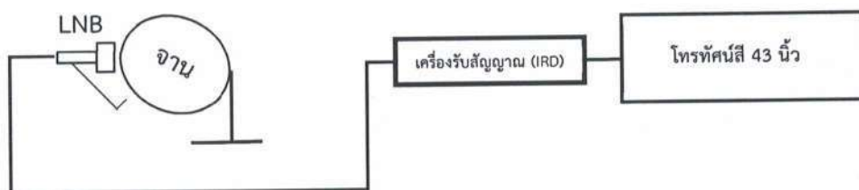
ภาพประกอบการติดตั้งจานดาวเทียม กลุ่มที่ 1

5.1.7 ต้องเดินสายไฟฟ้าชนิด VAF 2.5 SQ.mm. ตามมาตรฐานที่ การไฟฟ้ากำหนด ที่มีเต้ารับไม่น้อยกว่า 2 ช่อง สำหรับ Smart TV และเครื่องรับสัญญาณดาวเทียม (IRD)