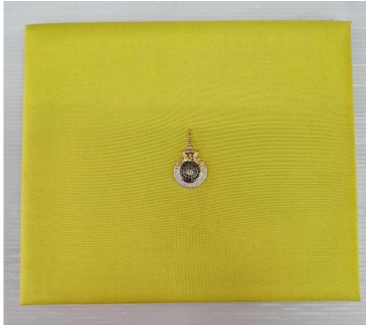
ด้านหลัง