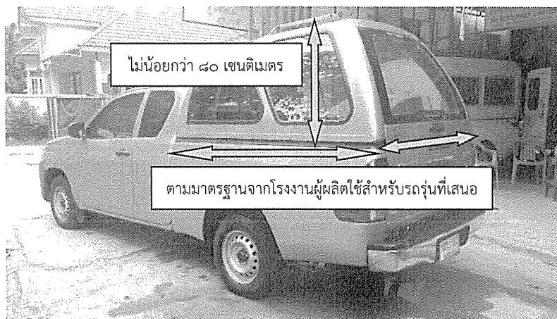
รูปภาพประกอบหลังคาไฟเบอร์กลาส