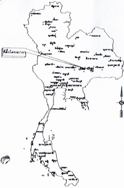
แผนที่ประเทศไทย

หรือมีพื้นที่ดำเนินการไม่น้อยกว่า 6,750 ตารางเมตร