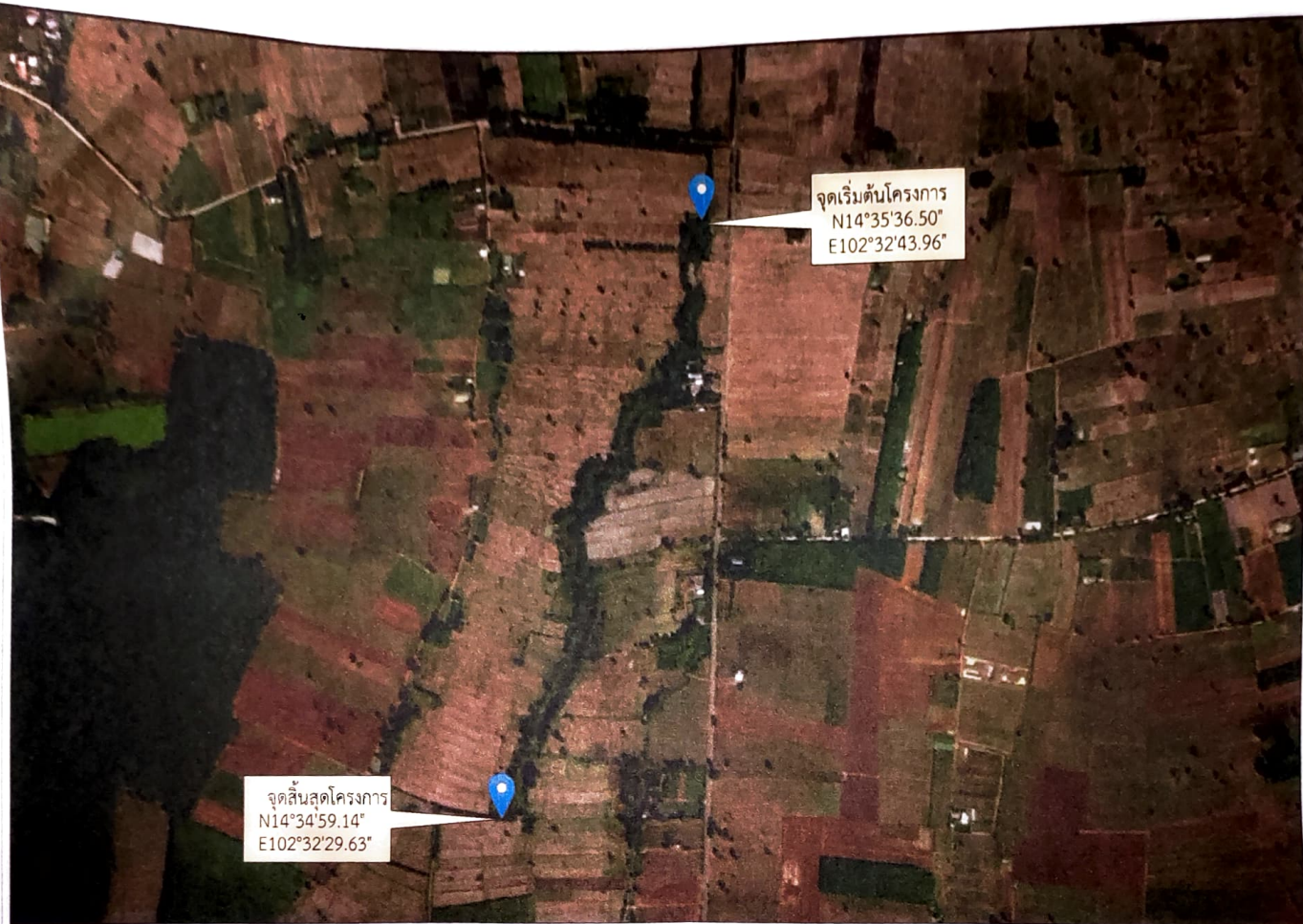
แผนที่สังเขปแสดงจุดที่จะดำเนินงาน

เรื่อง ขอบความเห็นชอบแต่งตั้งคณะกรรมการ วันที่