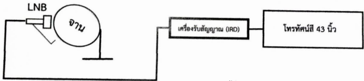
ภาพประกอบการติดตั้งงานดาวเทียม กลุ่มที่ 1

5.1.8 การติดตั้งจะต้องเป็นไปตามมาตรฐาน และเป็นของใหม่ไม่เคยใช้งานมาก่อน (โดยครุภัณฑ์ที่นำมาแสดงเป็นตัวอย่างไม่ถือว่าเป็นของใหม่เนื่องจากการใช้แล้ว)