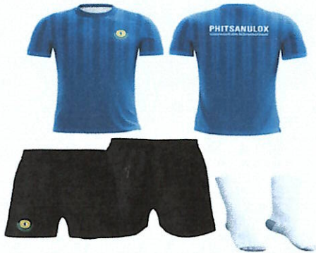
ชุดฝึกซ้อมกีฬา ชุดสีน้ำเงิน