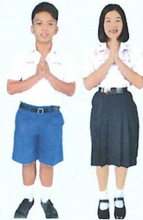
ชุดนักเรียนชายและนักเรียนหญิง ชั้นมัธยมศึกษาตอนปลาย