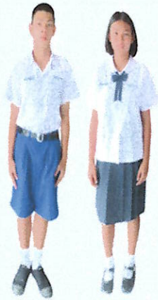
ชุดนักเรียนชายและนักเรียนหญิง ชั้นมัธยมศึกษาตอนต้น