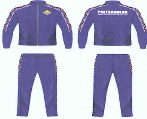
ชุดวอร์ม (อบอุ่นร่างกาย)