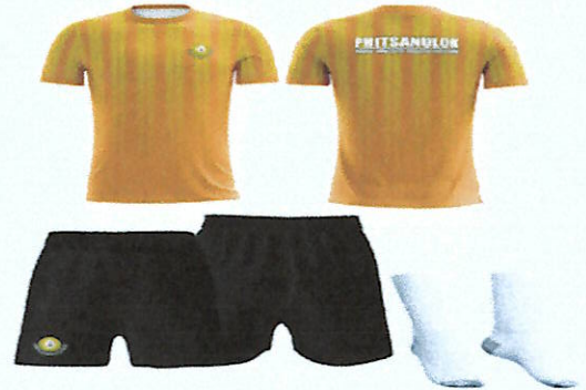
ชุดฝึกซ้อมกีฬา ชุดสีเหลือง