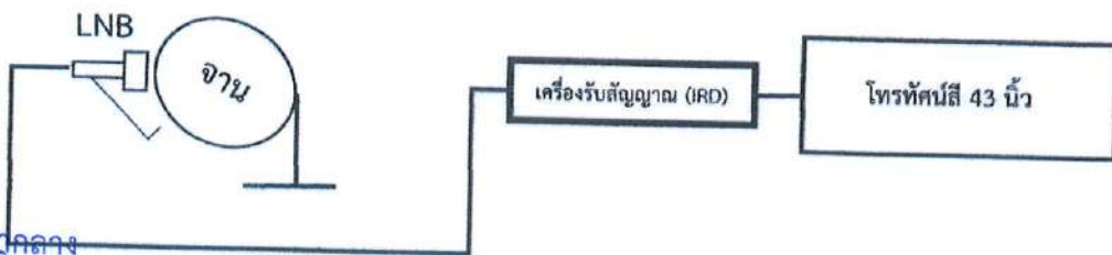
ภาพประกอบการติดตั้งจานดาวเทียม กลุ่มที่ 1

5.1.7 ต้องเดินสายไฟฟ้าชนิด VAF 1.5 SQ.mm. ตามมาตรฐานที่การไฟฟ้ากำหนด ที่มีเต้ารับไม่น้อยกว่า 2 ช่อง สำหรับ Smart TV และเครื่องรับสัญญาณภาพดาวเทียม (IRD)