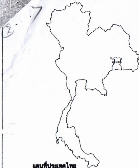
แผนที่ประเทศไทย