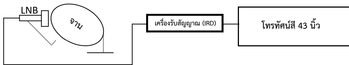
ภาพประกอบการติดตั้งจานดาวเทียม กลุ่มที่ 1

5.1.7 ต้องเดินสายไฟฟ้าผ่านอุปกรณ์ควบคุม เช่น คัทเอาต์ หรือ เบรกเกอร์ หรือ ตู้ load center หรือดีกว่า โดยใช้สายไฟฟ้าชนิด VAF 1.5 SQ.mm. ตามมาตรฐานที่การไฟฟ้ากำหนดที่มีเต้ารับไม่น้อยกว่า 2 ช่อง สำหรับ Smart TV และเครื่องรับสัญญาณภาพดาวเทียม (IRD)