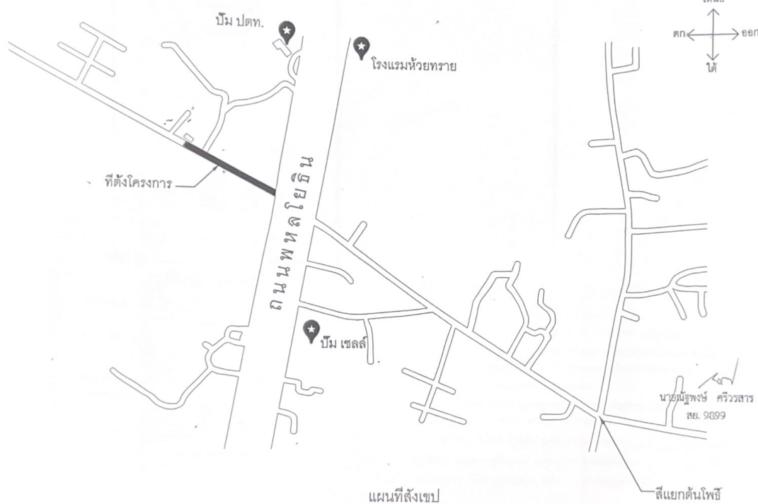
แผนที่สังเขป NOT TO SCALE

- จุดก่อสร้างวางระบายน้ำอยู่ฝั่งทิศใต้ของถนนทางเข้าวัดห้วยทองหลาง ความยาว 143 เมตร